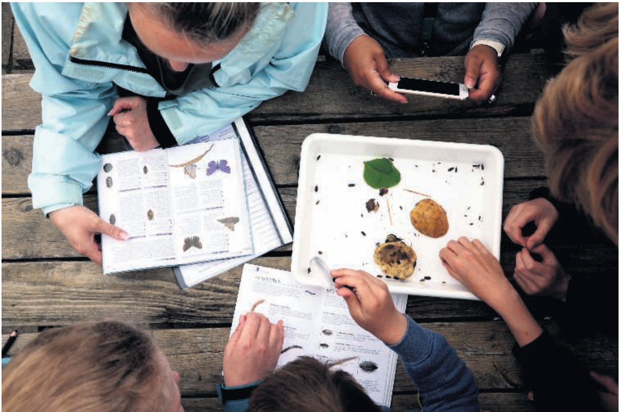
Hvad har vi fundet? Der er gang i lup og opslagsbøger for at finde de præcise navne på de mange forskellige planter, insekter og smådyr, som eleverne på Munkevængets Skole samlede sammen, da de deltog i Mylder på matriklen i onsdags.